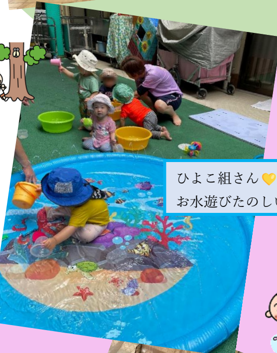
ひよこ組さん♡ お水遊びたのしいね。