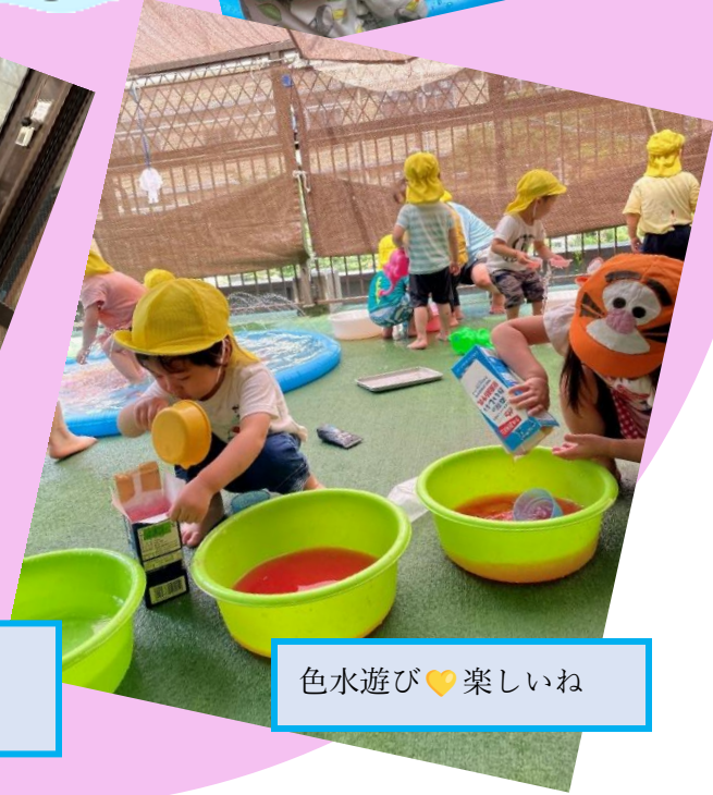
色水遊び♡楽しいね