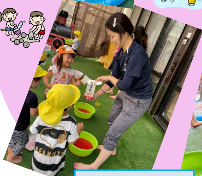
らっこ組さん 水遊び♡つめたいよ。