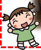
ひよこ組さん 園庭でお散歩