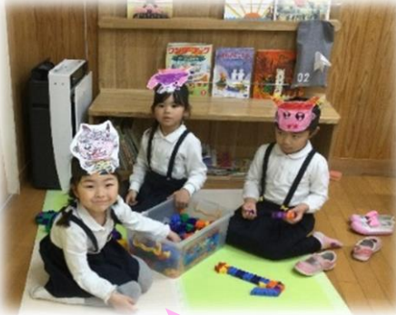
鬼のお面を作ったよ