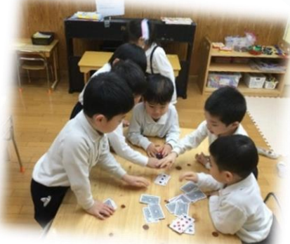
ルールを守ってお友だちと トランプ遊び