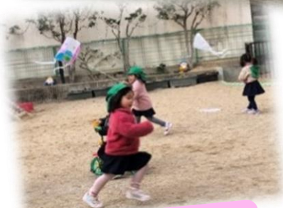
手作り凧！ よく上がるよ